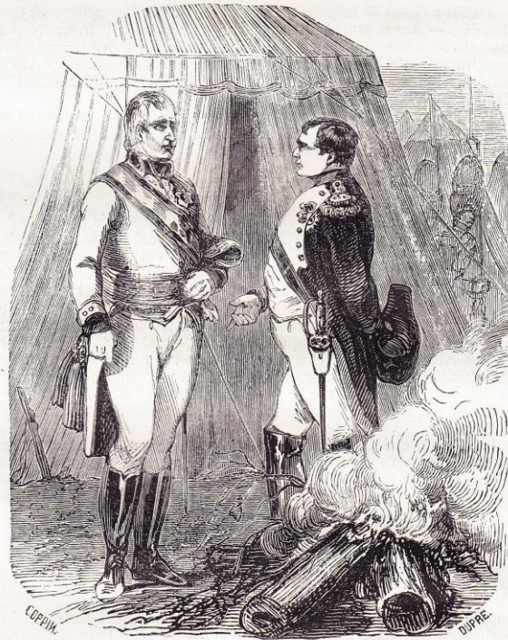
Entrevue des deux empereurs. Page 112.

Il rendit ensuite plusieurs décrets par lesquels il accorda des pensions aux veuves, et adopta les enfants des généraux, officiers et soldats morts à la bataille d'Austerlitz.